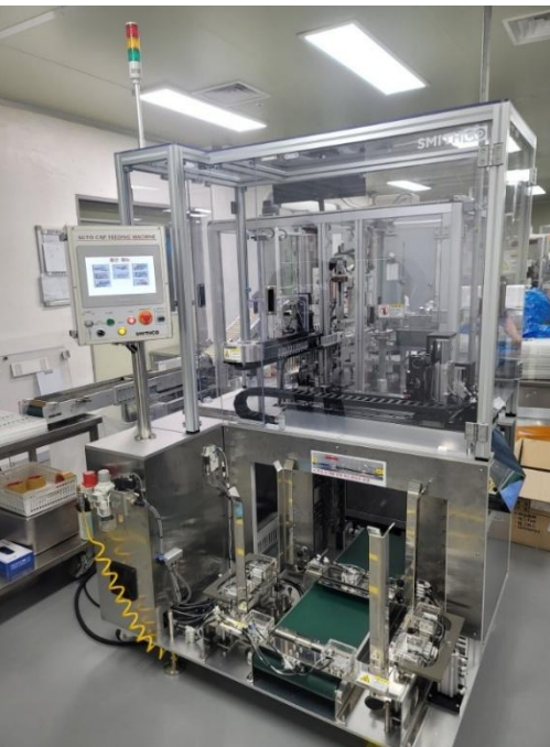
COSMAX 화성 2공장

“ 이동식 설비로 충전기에 부착하여 트레이에 담겨 납품된 캡을 자동 공급하는 시스템으로, 기존 수작업 대비 생산 효율과 작업 안정성을 동시에 확보 했습니다. ”